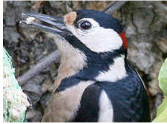
Diese Vögel mögen offensichtlich Styropor – zumindest das Geräusch