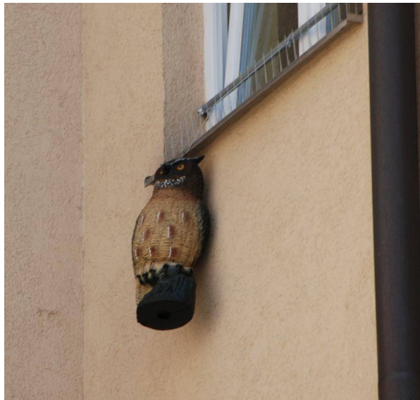
Feindattrappen (z. B. Uhu) – beweglich anbringen, Standort möglichst oft wechseln