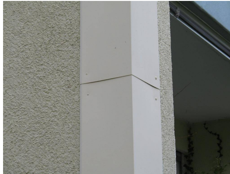
Blech-/Aluwinkel an Hausecken – verhindern das Festhalten der Spechte, wenn ausschließlich die Ecken behackt werden; Vorsicht: Die Dampfdiffusion des Wärmedämmverbundsystems darf nicht unterbunden werden!