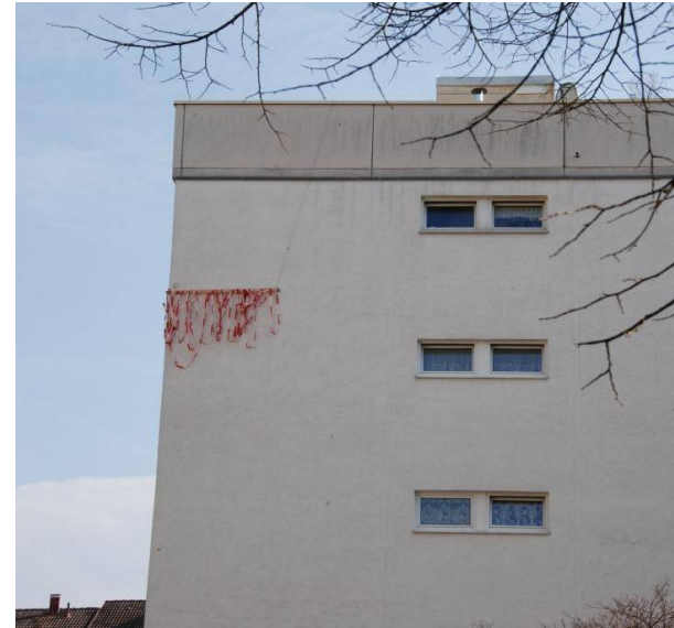
Girlanden aus Baustellen-Absperrband – möglichst großflächig anbringen