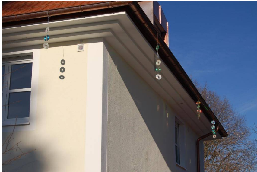
CD-Girlanden – je mehr, desto besser

Bitte beachten: Gewöhnungseffekte vermeiden durch möglichst häufigen Wechsel der Standorte (gilt nicht für Fassadenbegrünung, Eckwinkel)!