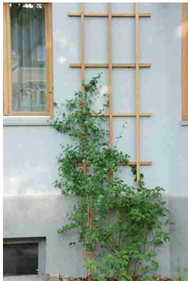
Lattenspalier mit Kletterrose

Die Rankhilfen – hier Drahtseile – sollten bis ganz nach oben geführt werden und auch die Ecken bedecken. Rankgitter (z. B. Stahlgittermatten) decken die gefährdeten Bereiche ab – auch ohne vollflächige Begrünung