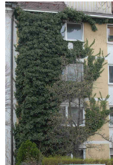
Nicht geeignet: Efeu - er kann die Putzschicht auf der Dämmung herunterreißen