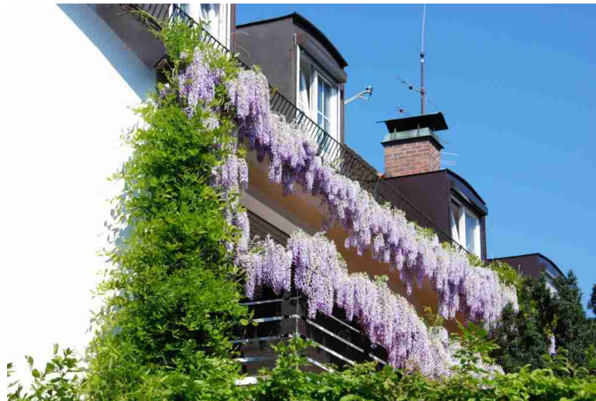
Geeignet: Blauregen. Er schlingt sich um die Rankhilfen.